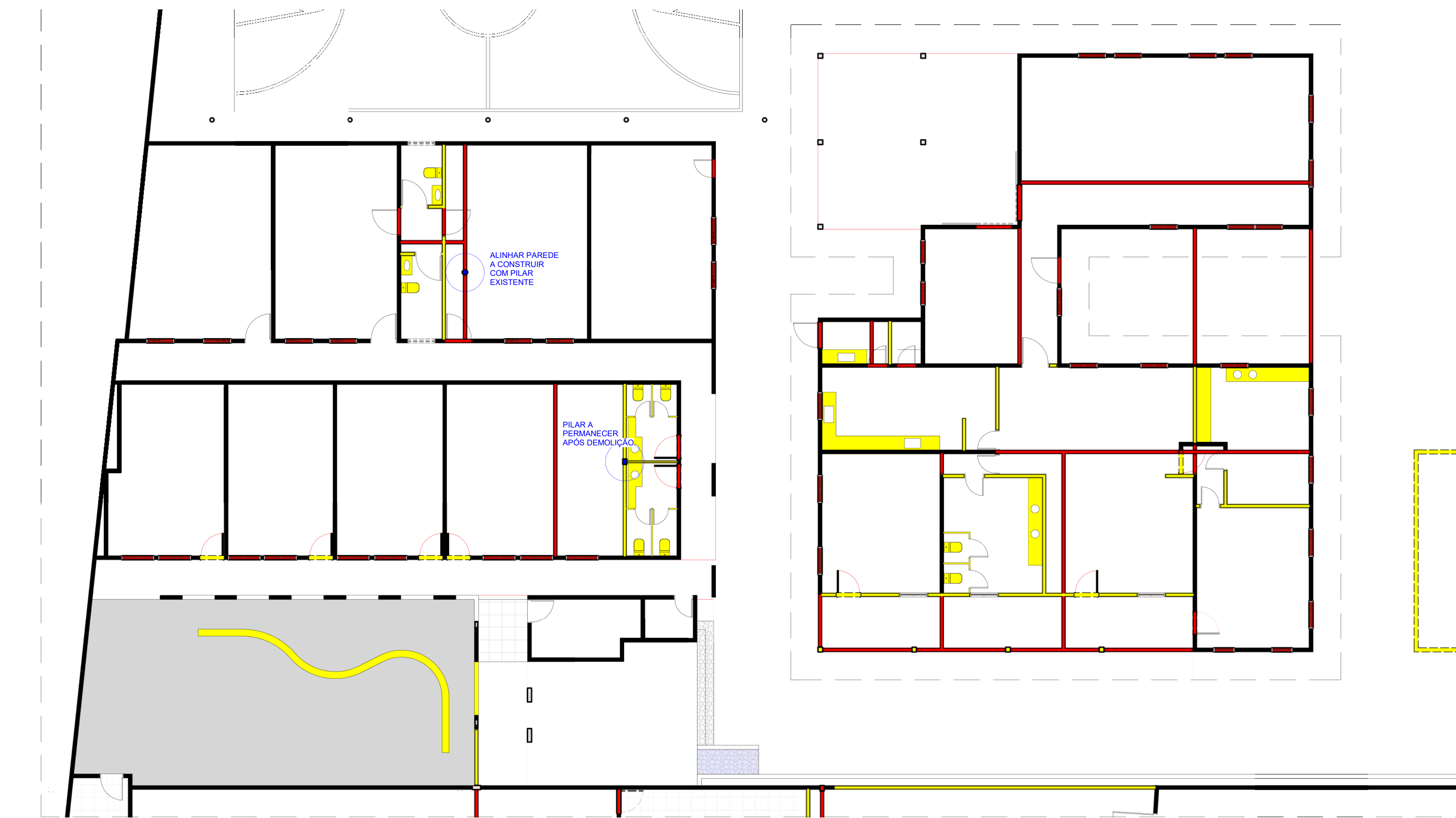
1 PILARES A MANTER - Casa da esquina ESCALA 1:100

TODA E QUALQUER INTERVENÇÃO QUE ENVOLVA ELEMENTOS ESTRUTURAIS DEVERÁ SER PREVIAMENTE AVALIADA E VALIDADA PELA RESPONSABILIDADE TÉCNICA DE ENGENHARIA ESTRUTURAL, GARANTINDO A SEGURANÇA E ESTABILIDADE DA EDIFICAÇÃO DURANTE O PROCESSO EXECUTIVO.